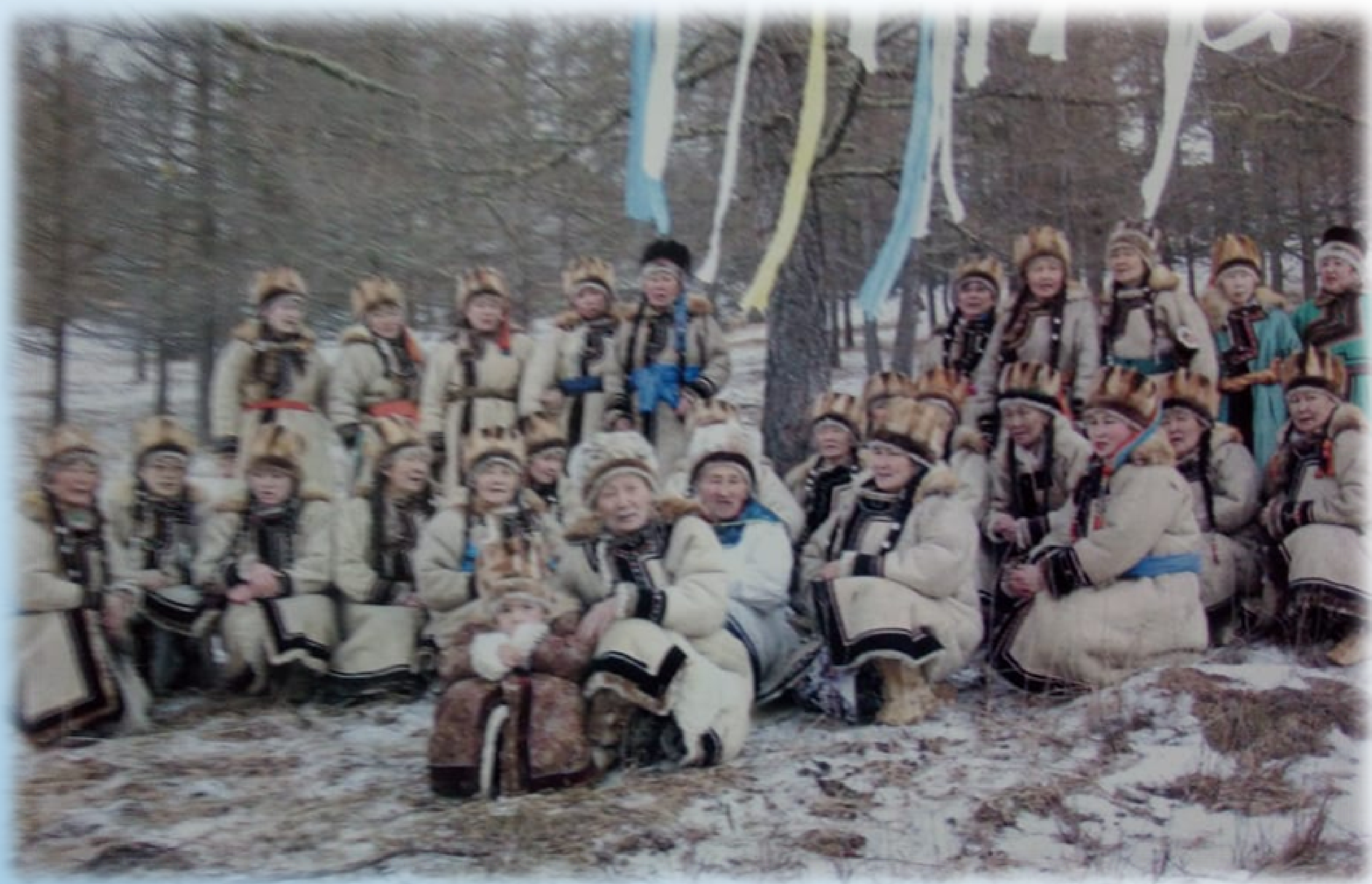
Ақар тонын кийген Урсул ичинин улузы