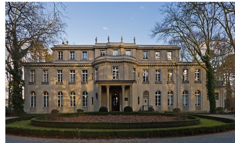
Бывшая вилла немецкого предпринимателя Эрнста Марлье, где проходило совещание. Ныне музей.

В результате этой встречи возникла отлаженная государственная система убийства людей в промышленных масштабах, легшая в основу тотального геноцида еврейского населения, — то, что позже назовут Холокостом .