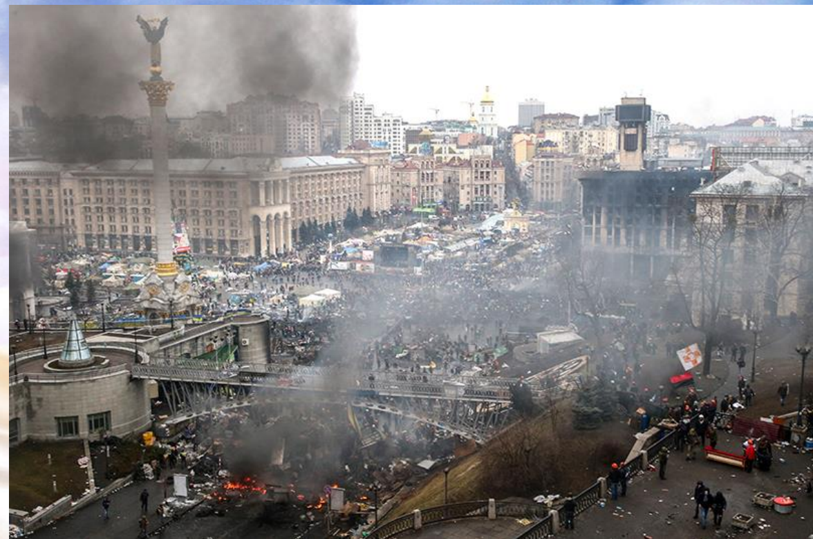
Беспорядки в районе площади Независимости. 20 февраля 2014 года.

На протяжении трехмесячных выступлений антиправительственных сил в Киеве и на западе Украины (с ноября 2013-го по февраль 2014-го) в Крыму большинство населения и значительная часть людей во властных структурах полуострова явно или косвенно демонстрировали свою поддержку официальной власти и неприятие методов и устремлений Майдана. И лишь Меджлис крымско-татарского народа с 21 по 23 февраля организовывал в Симферополе акции в поддержку тех, кто в эти дни свергал законно избранного президента страны Виктора Януковича, который вместе с семьёй был эвакуирован в Крым.