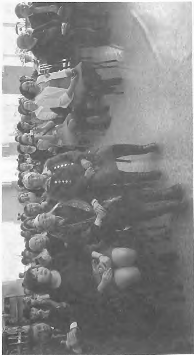
М.В. Чевалковтын адыла адалган библиотека, краеведение бөлүгү