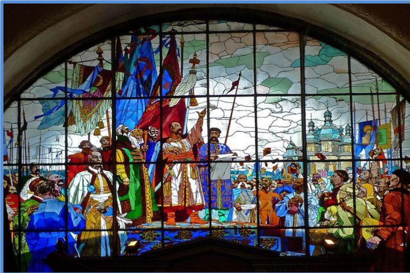
Витраж «Переяславская рада» в павильоне «Украина» на ВДНХ в 1954 г., к 300-летию события. (художники Г.В. Боня, В.В. Давыдов, С.А. Кириченко, С.Б. Отрощенко)