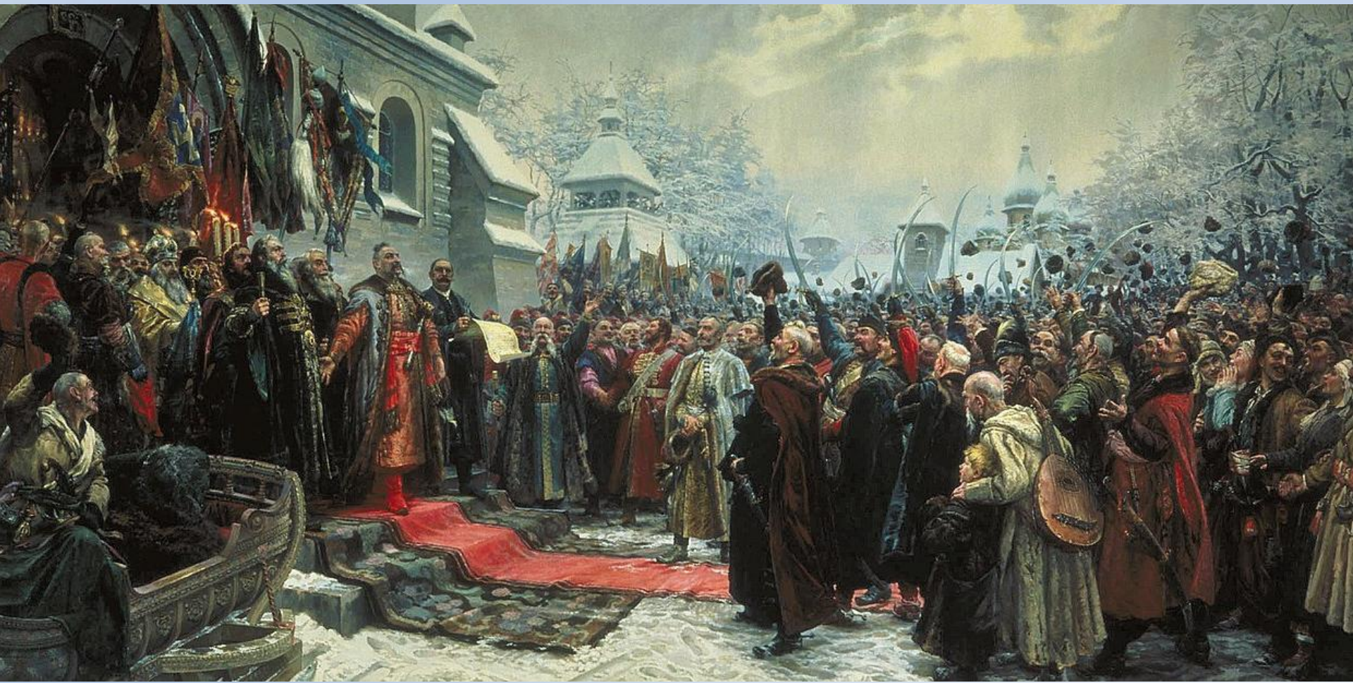
М.И. Хмелько, «Навеки с Москвой, навеки с русским народом» (1951)