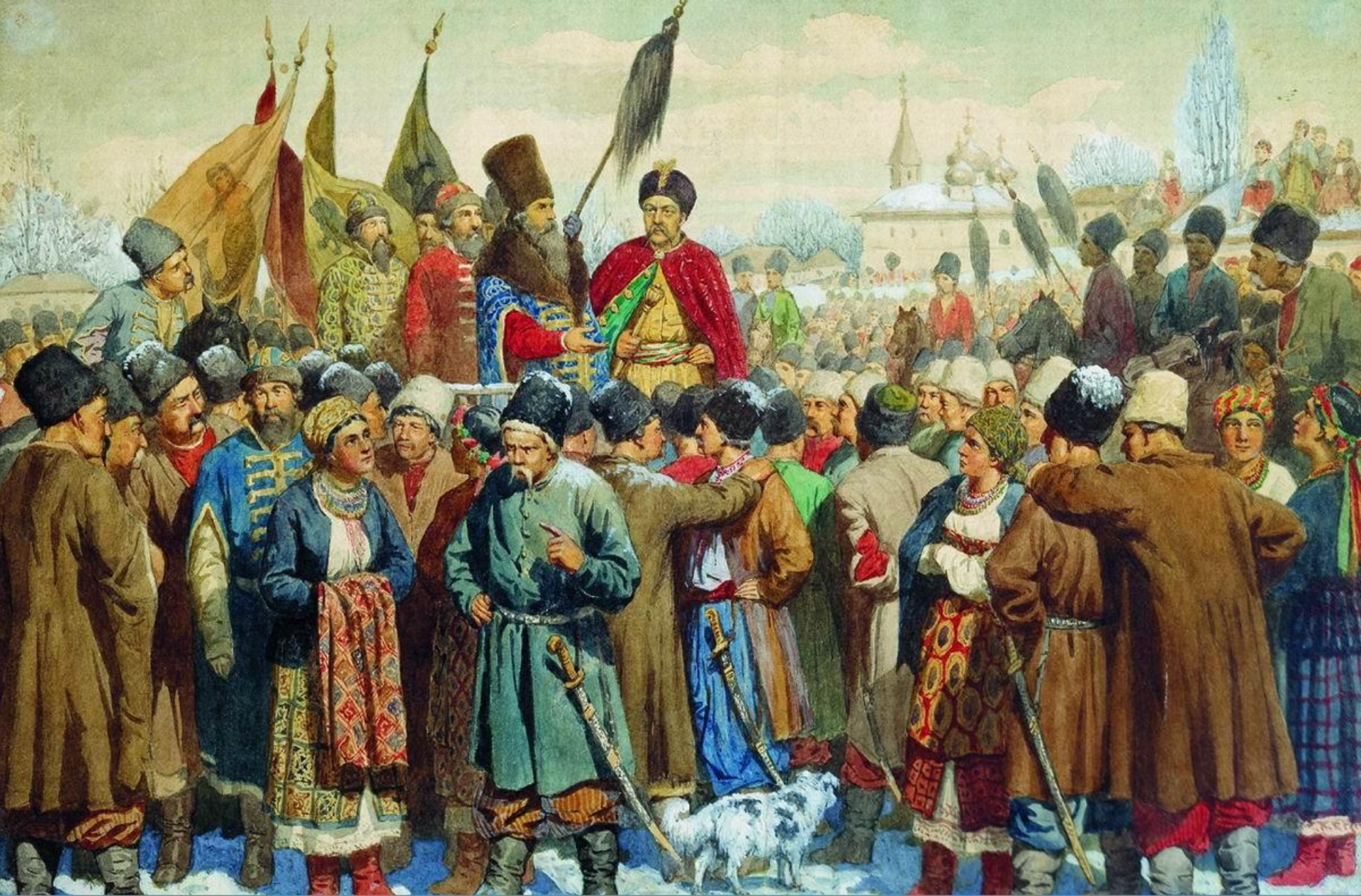
А.Д. Кившенко «Переяславская рада. 1654 год» (1880)