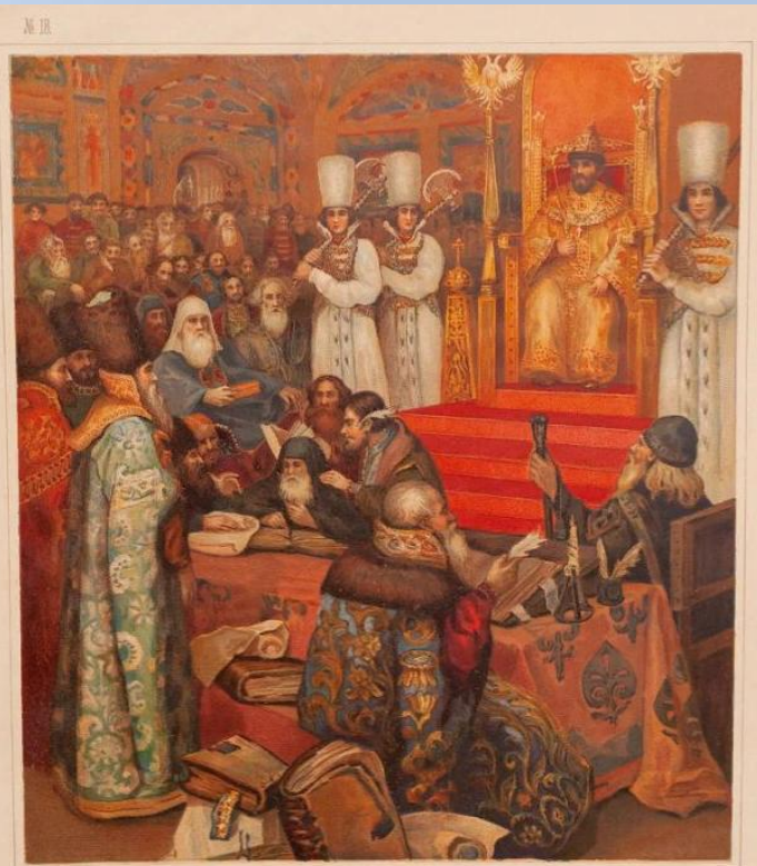
Картина Н. Некрасова.—СОСТАВЛЕНИЕ СОБОРНАГО УЛОЖЕНИЯ ПРИ АЛЕКСЕЕ МИХАЙЛОВИЧЕ (1649 г.).

На Земских соборах 1653 г. рассматривалась просьба гетмана Б.М. Хмельницкого и казацкой старшины о вхождении в состав Русского государства территории, подконтрольной Запорожскому войску... На заседании 4 июня была зачитана декларация правительства, в которой акцентировались польско-литовские «неправды» в отношении православного населения Речи Посполитой, новые «неисправления» польского короля Яна II Казимира по отношению к Русскому государству (в том числе враждебные международные акции), говорилось об общности судеб православных подданных польского короля и русского царя (отсутствие мира у Хмельницкого с Яном II Казимиром признавалось поводом к разрыву мирных отношений Русского государства с Речью Посполитой). Приговор Земского собора был единодушным – принять черкас в подданство и объявить войну Речи Посполитой. Окончательно принятие и оформление акта – приговора о принятии в подданство произошло на следующем Земском соборе 1(11) октября 1653 г. В документ, помимо собственно «приговора» думных чинов, вошли ещё два текста: военно-служилые лица обязались безупречной военной службой, а купцы и ремесленники приняли на себя финансовую поддержку грядущей русско-польской войны. Тогда же Земский собор выделил посольскую делегацию в Малороссию для приведения её жителей к присяге Алексею Михайловичу (прошла на Переяславской раде 1654 г.)